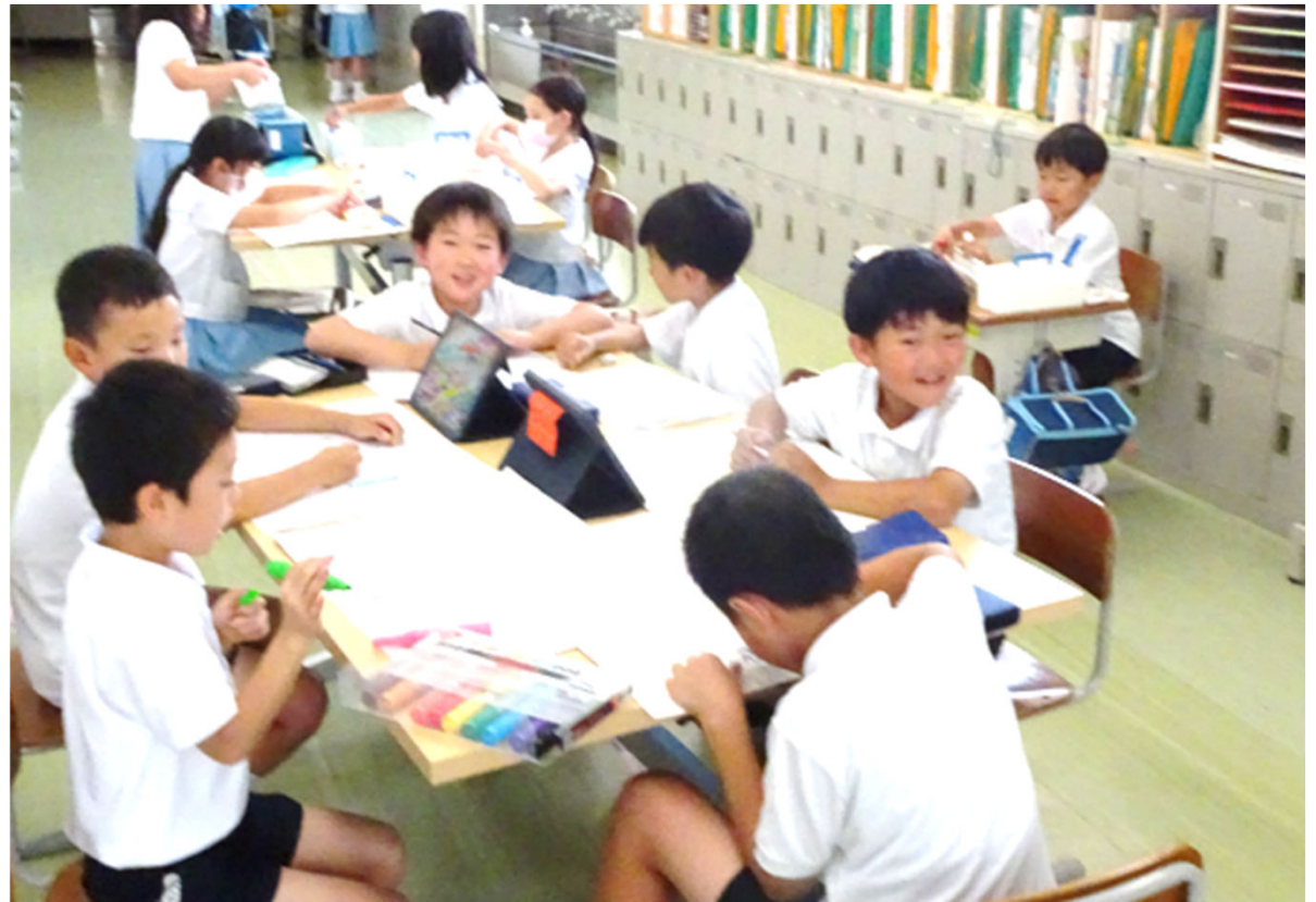
鳥取大学附属小学校